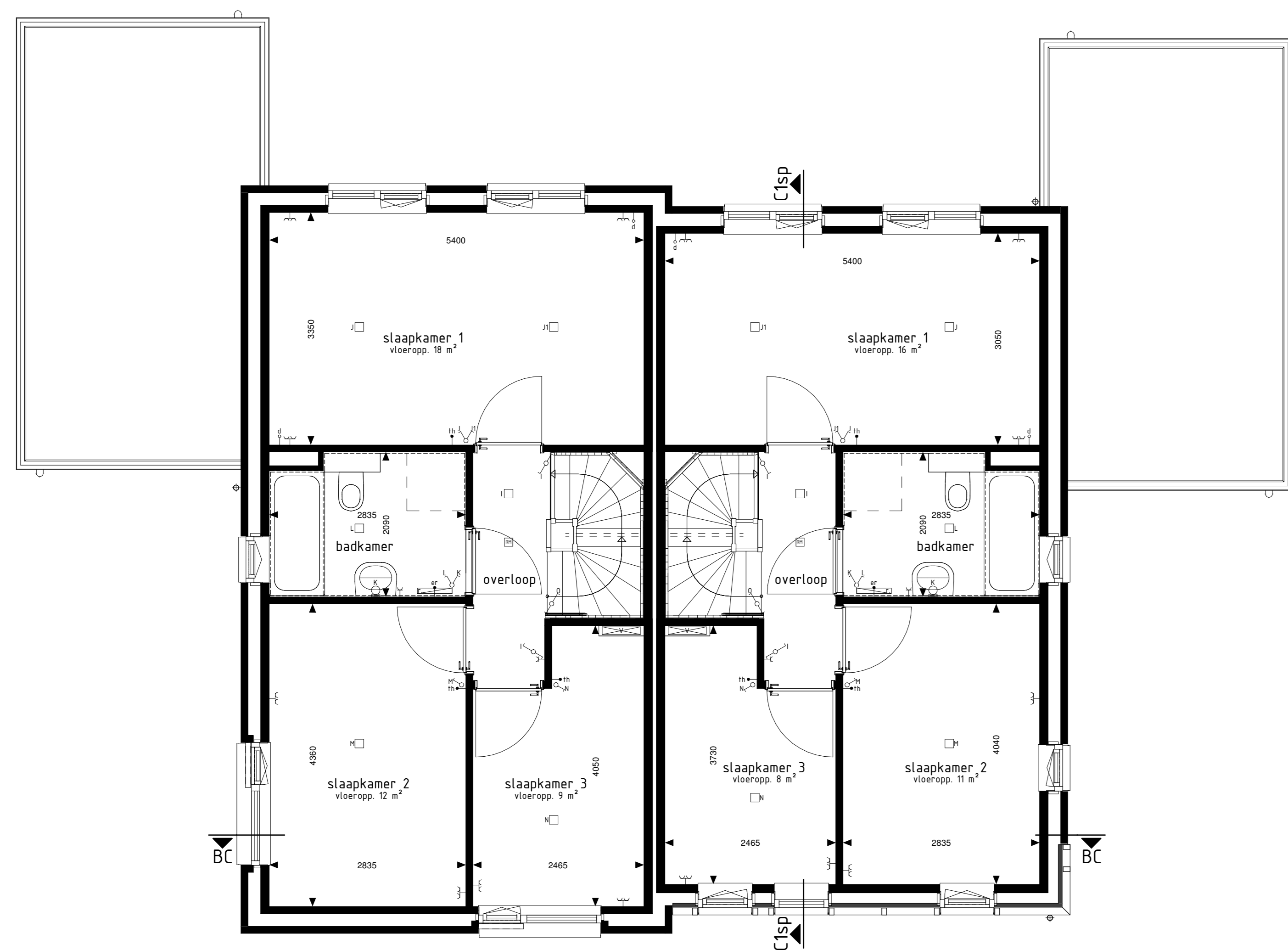
type B1 bwnr get.:205 type C1sp bwnr get.:206 1e VERDIEPING