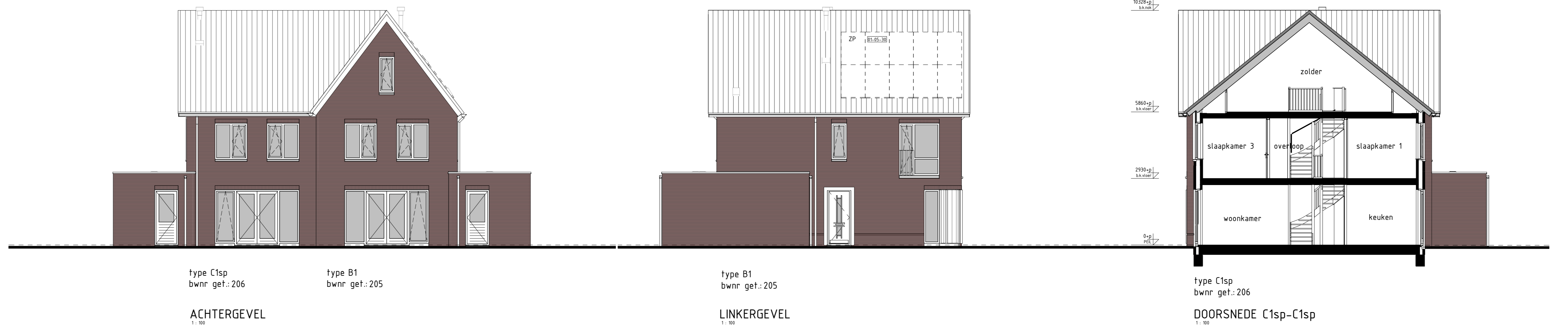
type C1sp bwnr get.:206 ACHTERGEVEL